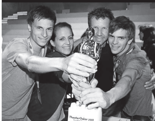
Zmagovalci / Die Sieger

Sledi družabni del s skupino »Turbo Blues« iz Slovenije ☀ Danach Fest und Musik mit der Gruppe »Turbo Blues« aus Slowenien.