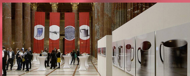
Slika na naslovnici: Novice