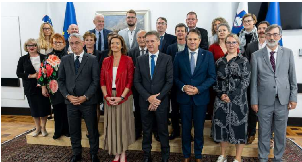
Predstavniki Slovencev v zamejstvu z ministri in ministricami ter predsednikom vlade RS dr. Robertom Golobom. Dr. Golob je hkrati tudi predsednik Sveta Vlade, podpredsednik pa je minister za Slovence v zamejstvu in po svetu Matej Arčon.

Nach der Sitzung sagte Matej Arčon, dass „die zweieinhalbstündige, inhaltsreiche Debatte ein Beweis für die Bedeutung der Themen im benachbarten Grenzgebiet sowie Ausland für Slowenien, eine Grundlage für die weitere Arbeit und ein Ausdruck der Dankbarkeit für die Bemühungen unserer Landsleute um die Bewahrung der slowenischen Identität ist.“ Auf der Sitzung berichteten die Ratsmitglieder aus dem Ausland, informierten den Rat über die Herausforderungen, denen sie sich derzeit gegenübersehen, und brachten ihren Dank für die Hilfe und Unterstützung der Republik Slowenien und ihrer Ministerien zum Ausdruck. Die Diskussion konzentrierte sich auch auf die bevorstehenden Herausforderungen und mögliche Maßnahmen, die in der nächsten Zeit ergriffen werden sollten.